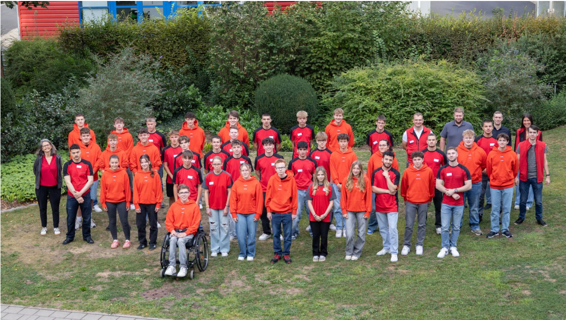
Insgesamt 39 neue Auszubildende starteten zum September ihre Berufslaufbahn bei DEHN.

Simon Thaler Director Corporate Communications Tel.: +49 9181 906 2339 Mobil: +49 151 146 308 90 simon.thaler@dehn.de